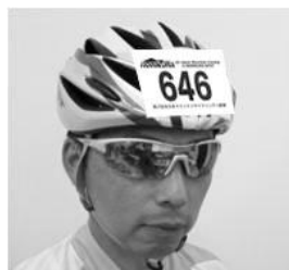
▲ヘルメットシールの取付