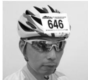
▲ヘルメットシールの取付